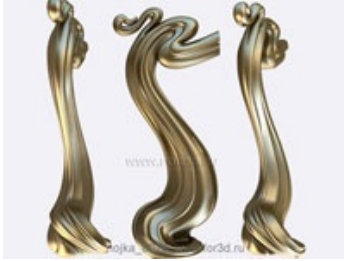
Ножка 0029 | stl - 3d модель для ЧПУ