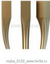
Ножка 0123 | stl - 3d модель для ЧПУ