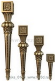
Ножка 0110 | stl - 3d модель для ЧПУ