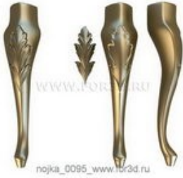
Ножка 0095 | stl - 3d модель для ЧПУ