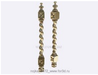
Ножка 0073 | stl - 3d модель для ЧПУ