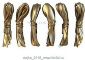
Ножка 0119 | stl - 3d модель для ЧПУ