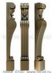
Ножка 0100 | stl - 3d модель для ЧПУ