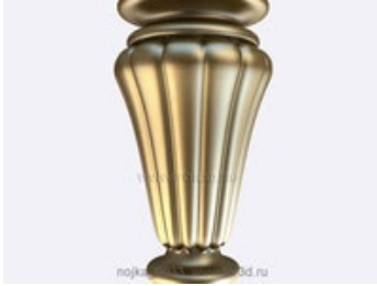
Ножка 0034 | stl - 3d модель для ЧПУ