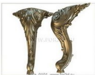
Ножка 0101 | stl - 3d модель для ЧПУ