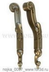
Ножка 0097 | stl - 3d модель для ЧПУ