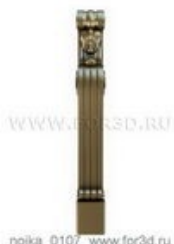
Ножка 0107 | stl - 3d модель для ЧПУ