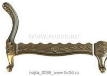
Ножка 0098 | stl - 3d модель для ЧПУ