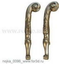
Ножка 0096 | stl - 3d модель для ЧПУ