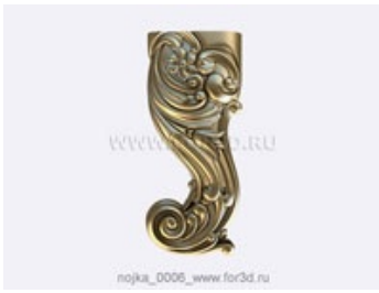
Ножка 0007 | stl - 3d модель для ЧПУ