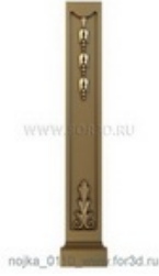
Ножка 0111 | stl - 3d модель для ЧПУ