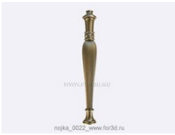
Ножка 0023 | stl - 3d модель для ЧПУ