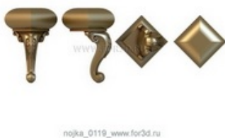
Ножка 0120 | stl - 3d модель для ЧПУ