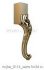
Ножка 0115 | stl - 3d модель для ЧПУ