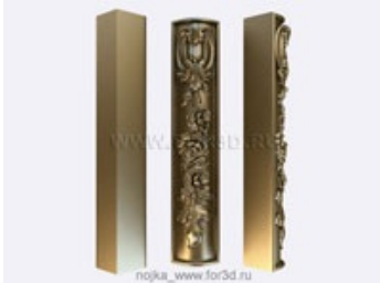
Ножка 0020 | stl - 3d модель для ЧПУ