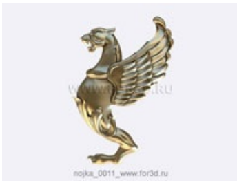
Ножка 0012 | stl - 3d модель для ЧПУ