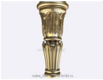
Ножка 0048 | stl - 3d модель для ЧПУ