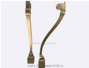
Ножка 0037 | stl - 3d модель для ЧПУ