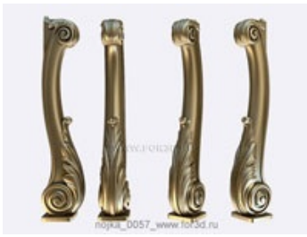
Ножка 0058 | stl - 3d модель для ЧПУ