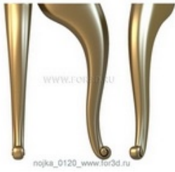
Ножка 0121 | stl - 3d модель для ЧПУ