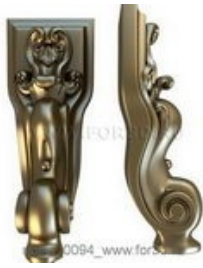
Ножка 0094 | stl - 3d модель для ЧПУ