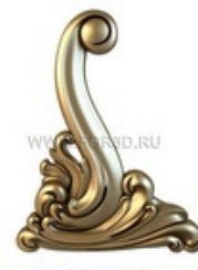
Ножка 0108 | stl - 3d модель для ЧПУ