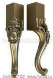
Ножка 0102 | stl - 3d модель для ЧПУ