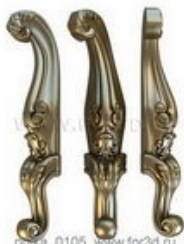
Ножка 0105 | stl - 3d модель для ЧПУ