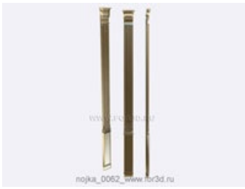
Ножка 0063 | stl - 3d модель для ЧПУ