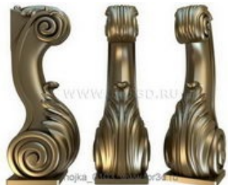
Ножка 0103 | stl - 3d модель для ЧПУ