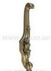
Ножка 0106 | stl - 3d модель для ЧПУ