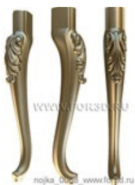
Ножка 0089 | stl - 3d модель для ЧПУ