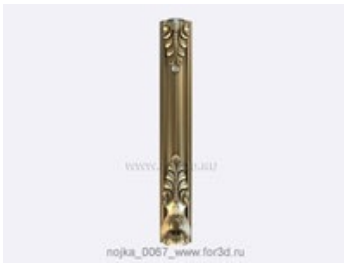
Ножка 0068 | stl - 3d модель для ЧПУ