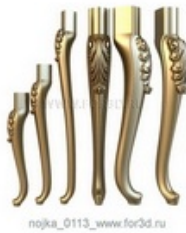
Ножка 0114 | stl - 3d модель для ЧПУ